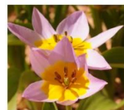
VOOR IN EEN POT